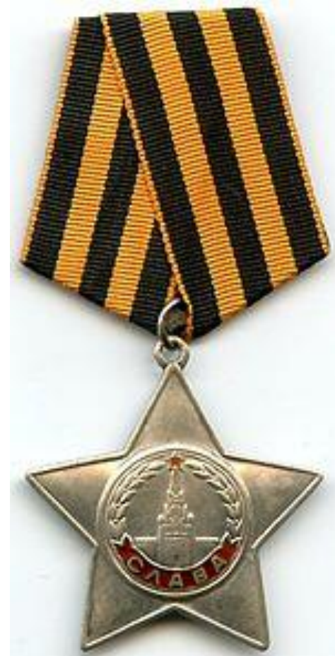
ОРДЕНА СЛАВЫ III СТЕПЕНИ