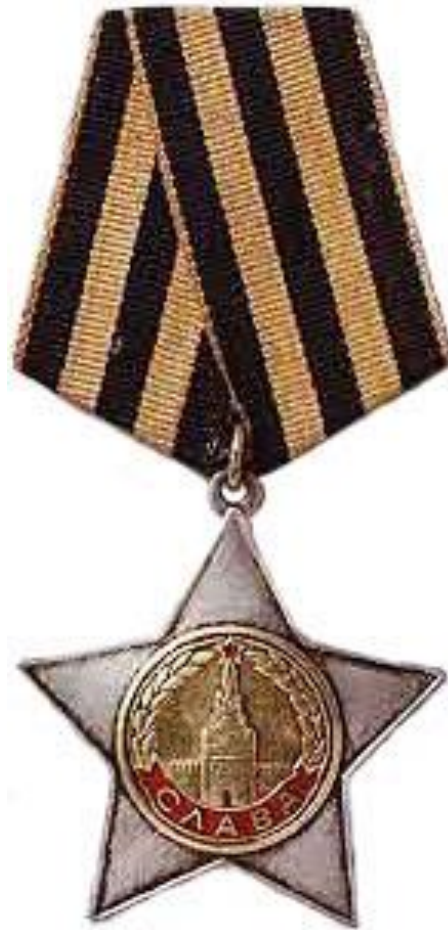
ОРДЕНА СЛАВЫ II СТЕПЕНИ