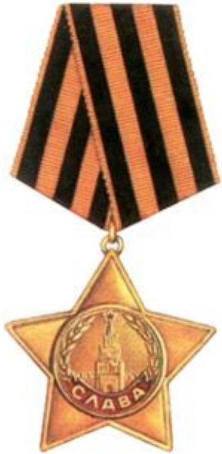
ОРДЕНА СЛАВЫ I СТЕПЕНИ